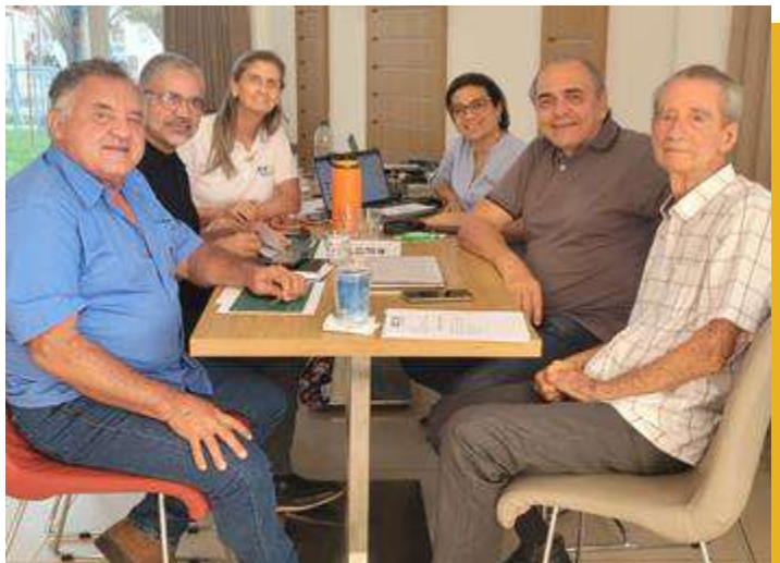
Reunião Mensal no dia 20/02/2025 Indicação FIEB – Feira de Santana.