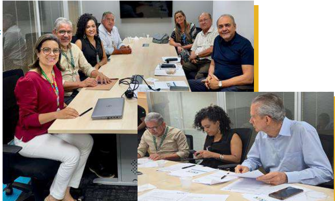
Reunião Mensal no dia 18/11/2025 - Sede Coelba.