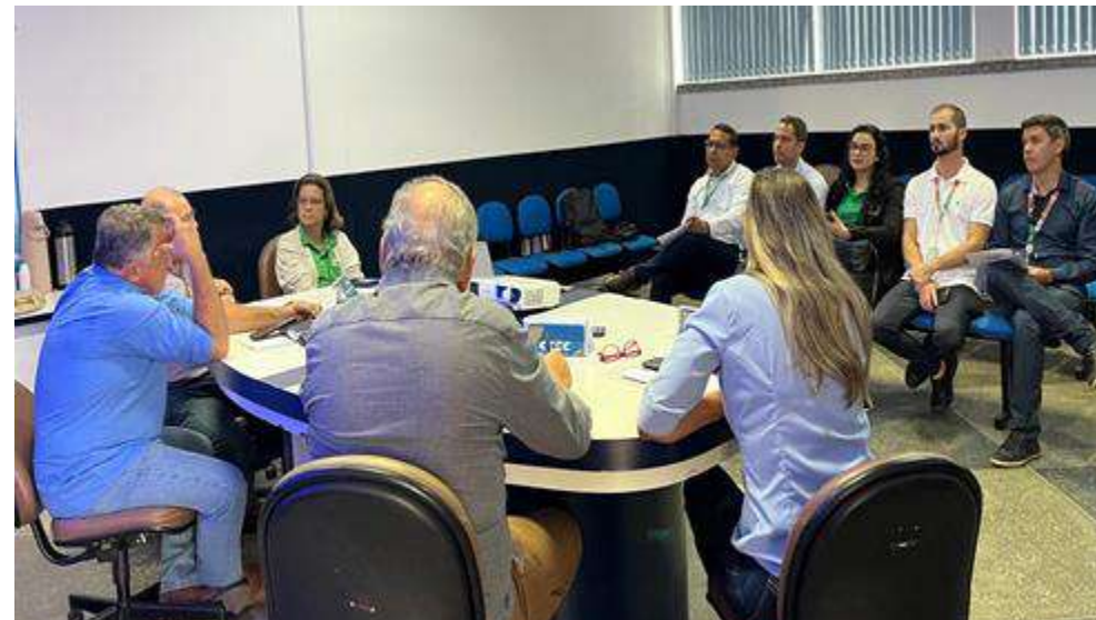
Reunião Pública no dia 15/05/2025 - Irecê.