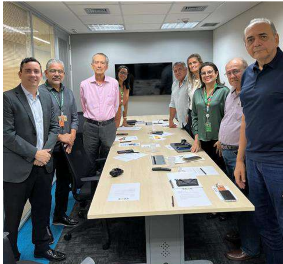
Reunião Mensal no dia 14/08/2025 – Sede Coelba.