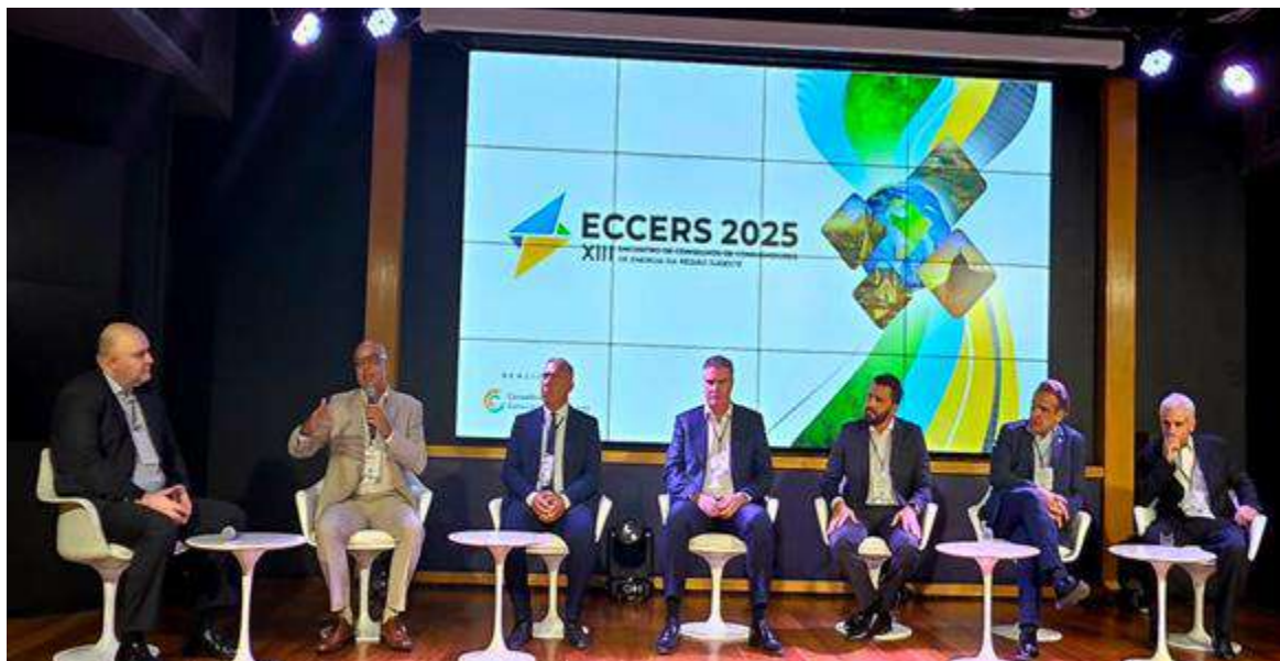
XIII Encontro de Conselho de Consumidores de Energia da Região Sudeste nos dias 21 e 22/08/2025 no Rio de Janeiro.