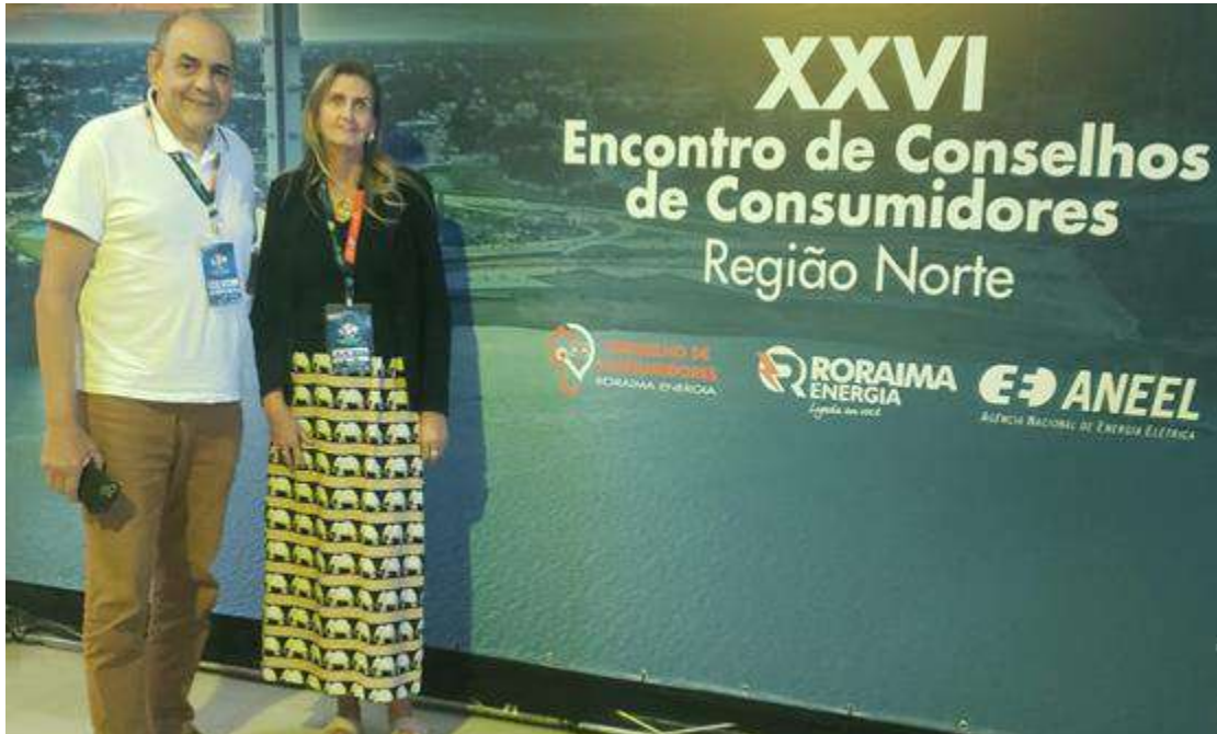
Encontro de Conselho de Consumidores da Região Norte nos dias 27 e 28/03/2025 em Bela Vista-RR.