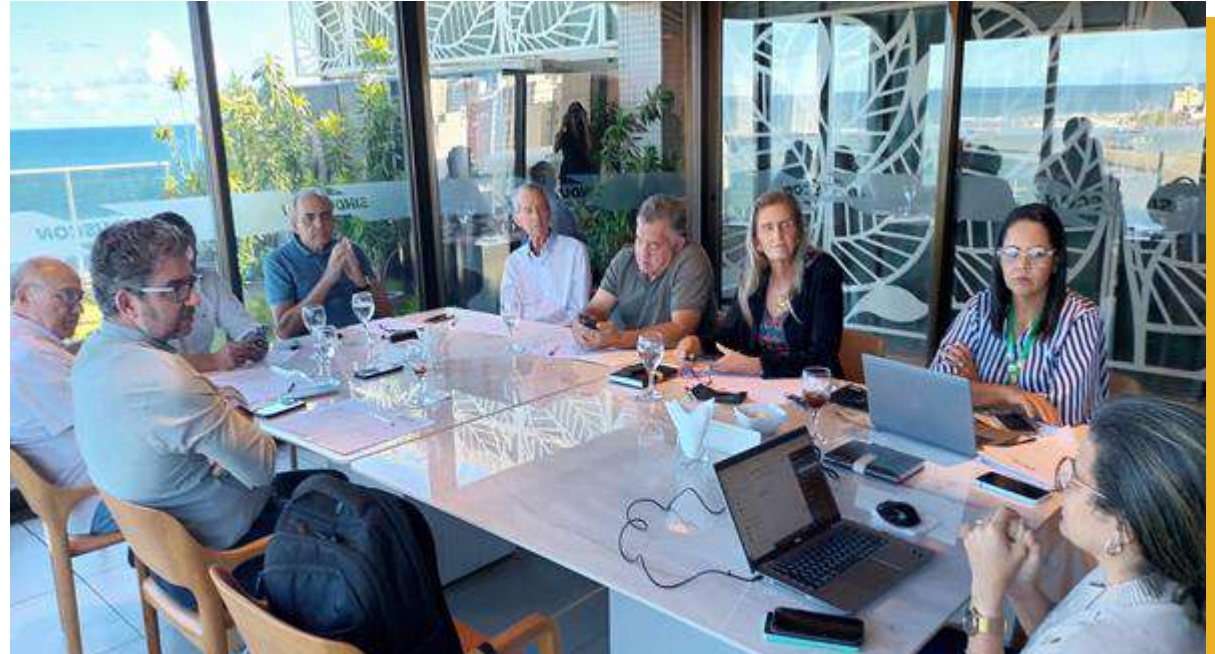
Reunião Mensal no dia 04/04/2025 – Sinduscon.