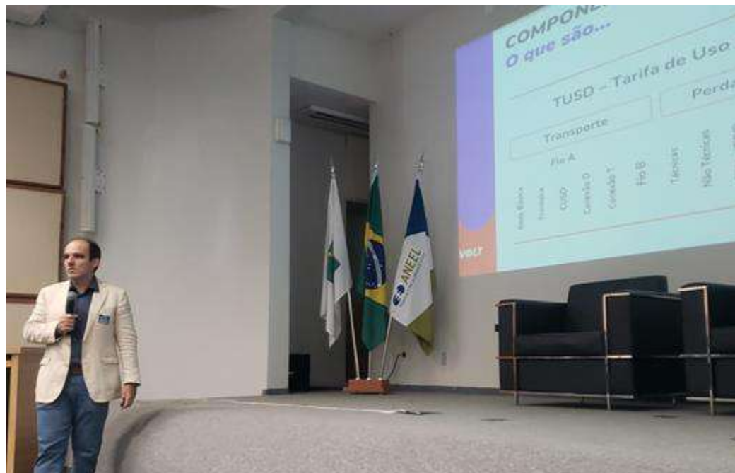
Treinamento para presidente e vice-presidente no dia 25/04/2025 em Brasília-DF.