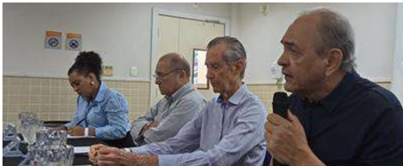
Reunião Pública no dia 25/09/2025 - Porto Seguro Senac.