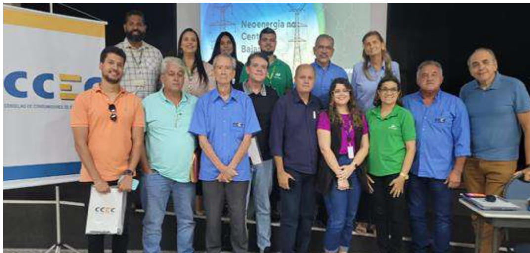
Reunião Pública no dia 21/02/2025 Indicação FIEB – Feira de Santana.