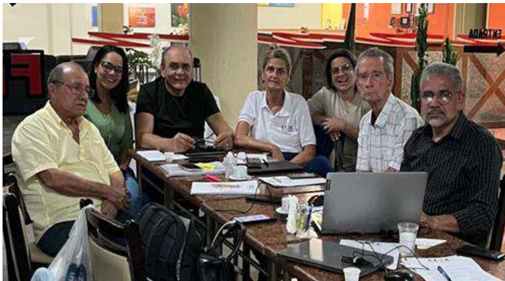
Reunião Mensal no dia 22/07/2025 - Jacobina CDL.