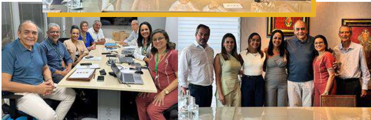
Reunião Mensal no dia 12/12/2025 - Sede Coelba e almoço Restaurante Casa do Comércio