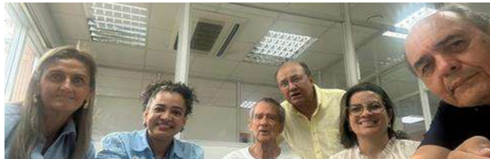
Reunião Mensal no dia 25/09/2025 - Porto Seguro Senac.