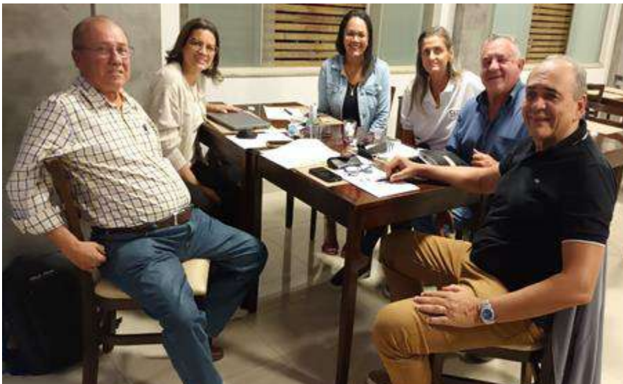
Reunião Mensal no dia 14/05/2025 - Irecê.