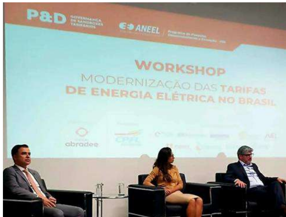
Workshop sobre Modernização das Tarifas de Energia Elétrica no Brasil no dia 13/02/2025 em Brasília-DF.