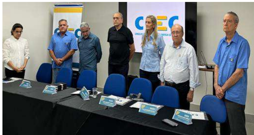
Reunião Pública no dia 23/07/2025 – Jacobina CDL.